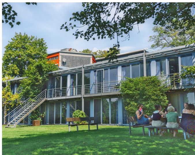
Außenbereich der Akademie der kulturellen Bildung in Remscheid.